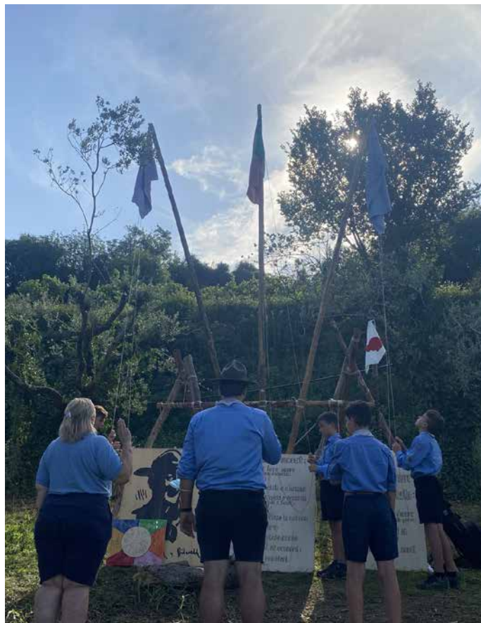
Gli Scout davanti al ritratto di Baden-Powell