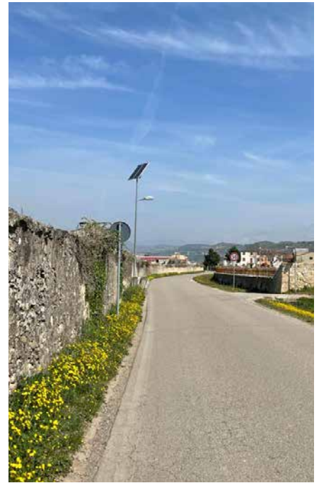
Tre punti del possibile passaggio della Romea Strata nel nostro territorio. Da sinistra: pozzo in contrada Fontana situato su di un cortile pensile; sullo sfondo la chiesa di San Giacomo al Grigliano; il tratto della Romea che si dirige verso Colognola ai Colli.

cere di camminare, si cammina in gruppo, si va da soli.