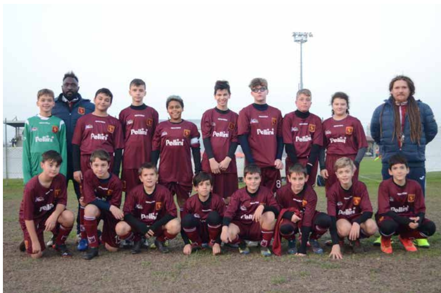
Foto di gruppo degli Esordienti con i loro allenatori prima di una partita

In tre anni la crescita è stata costante: partendo nel settembre 2019 da zero e fino a portare sul campo oltre 70 ragazzi e ragazze di età tra i 6 ed i 12 anni, suddivise per fasce di età ed affidati ad istruttori qualificati ed entusiasti, dediti ai propri ragazzi ed orgogliosi di indirizzarli nel percorso