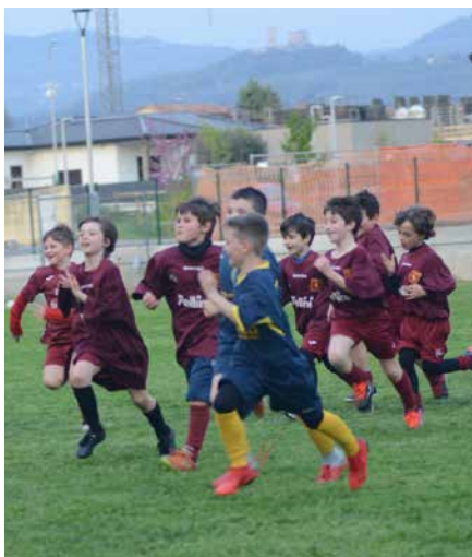
I ragazzi dei Primi calci in campo

educativo-sportivo condiviso con i tecnici della Società San Zeno.