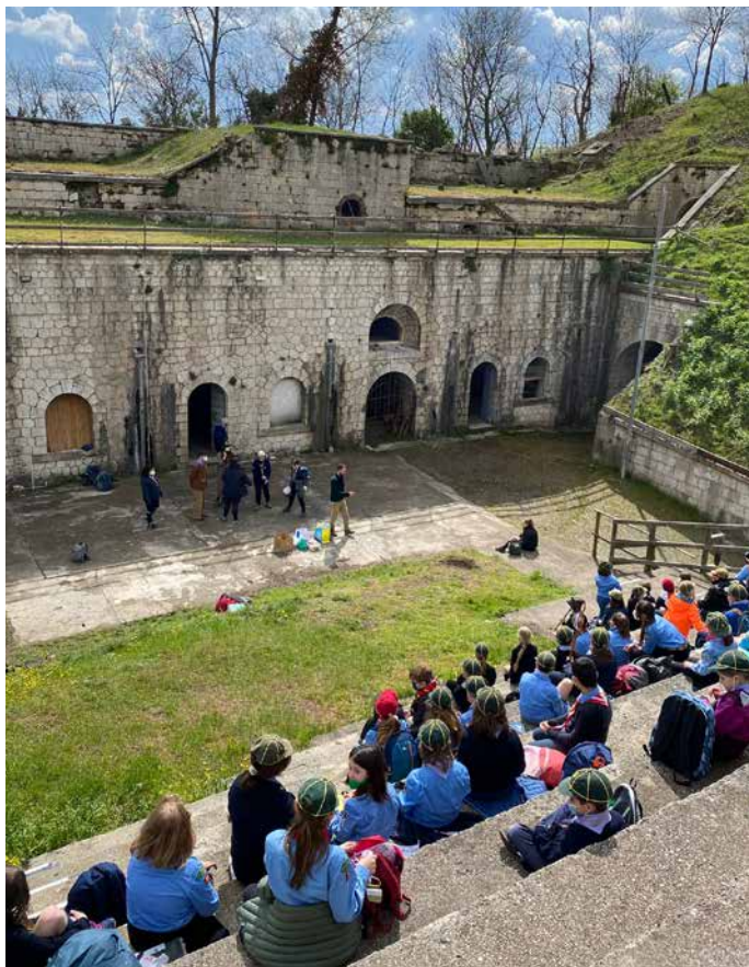
Lupetti e Coccinelle durante una delle attività del 3 aprile