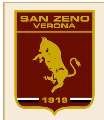
Lo stemma del San Zeno Calcio

nesso l'avvio del nuovo progetto granata. Stiamo infatti arrivando alle fasi finali della terza stagione sportiva gestita dal San Zeno presso gli impianti comunali di Vago e San Pietro. Sono stati tre anni molto intensi che