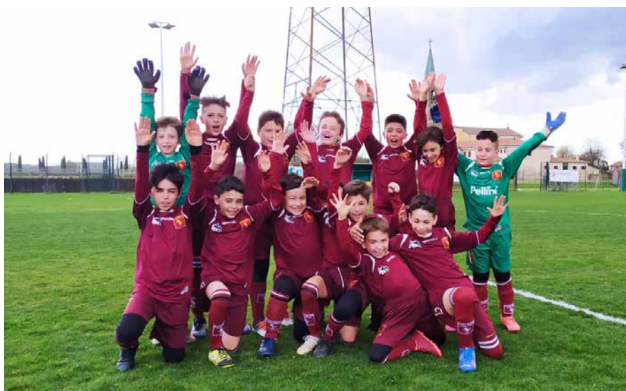
Il gruppo dei giovani calciatori Pulcini salutano festosi il fotografo