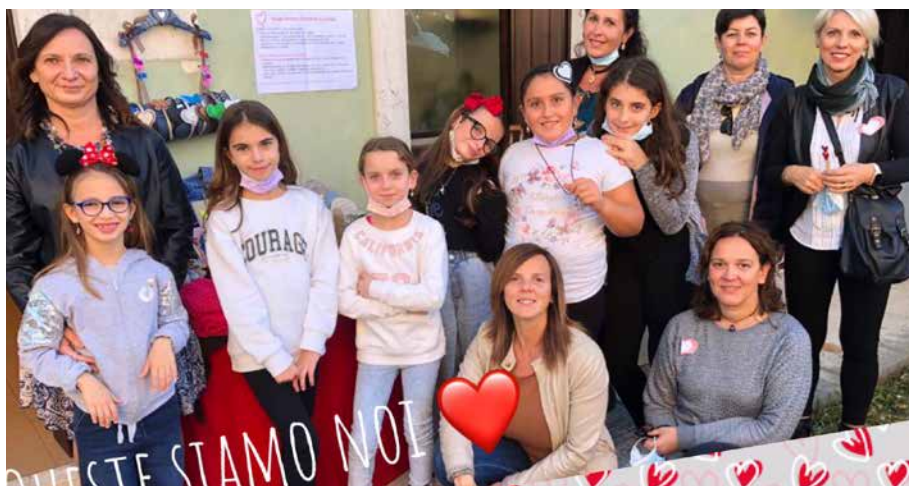
Foto di gruppo dell'Associazione Mamme Volenterose di Lavagno