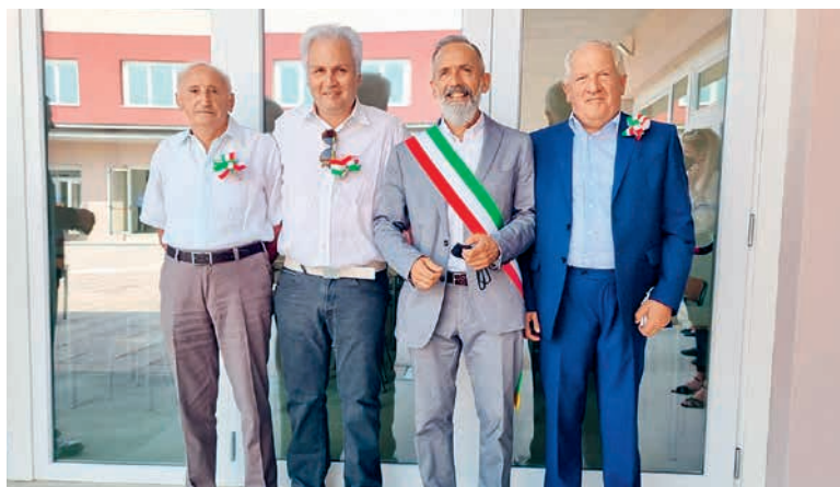
I sindaci attuale e delle passate amministrazioni all'inaugurazione della nuova scuola, a destra il consiglio comunale dei ragazzi

Quando un'amministrazione comunale costruisce una scuola