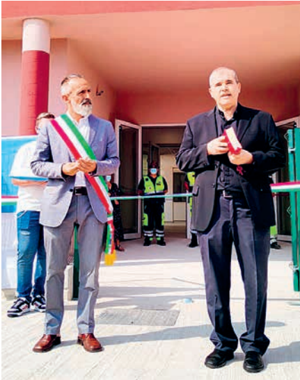
Sindaco e parroco all'inaugurazione