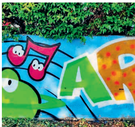
I ragazzi di San Pietro al lavoro per rinnovare il parco di via Quarto