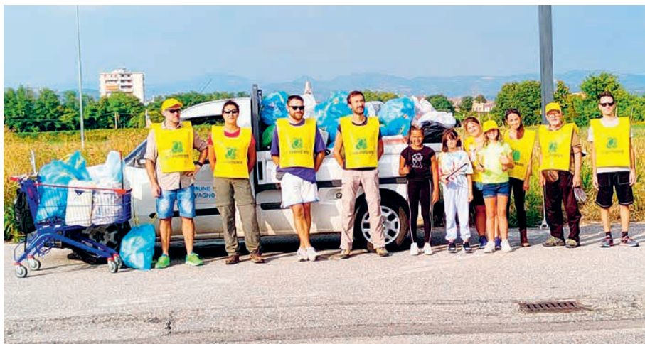
Il gruppo di volontari che ha partecipato alla giornata Puliamo il Mondo

Adulti e ragazzi hanno aderito con entusiasmo all'iniziativa delle Associazioni Legambiente e Plastic Free