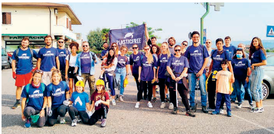
Foto di gruppo dei volontari che hanno aderito alla giornata Plastic Free

“Lasciate il mondo un po' migliore di come l'avete trovato”, è l'appello lanciato da Robert Baden Powell, il fondatore del movimento scout, nell'ultima sua lettera indirizzata a tutti gli Scout del mondo. Anche a questo, sicuramente, hanno pensato i numerosi volontari sia adulti che bambini, che nei giorni di sabato 25 e domenica 26 settembre hanno partecipato alle giornate ecologiche proposte dall'Amministrazione Comunale in collaborazione con le associazioni Legambiente e Plastic Free.