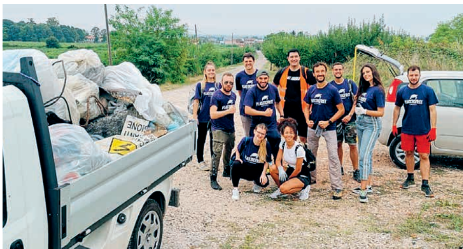
Un carico di plastica abbandonata raccolta dai volontari