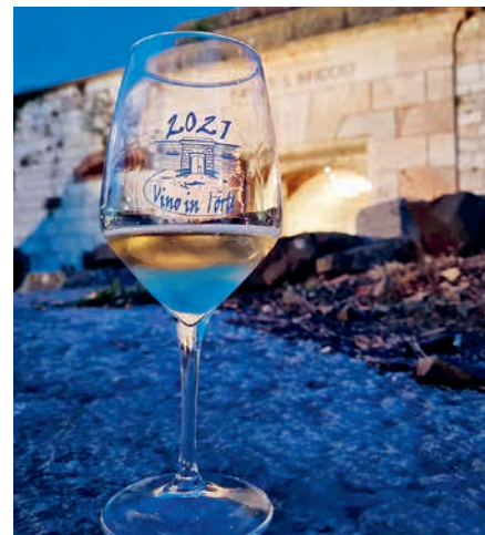
Due momenti di Vino in Corte che ha richiamato numerosi concittadini al Forte di San Briccio