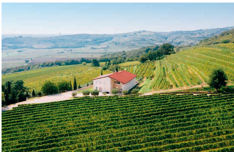
Una veduta dei vigneti di Talestri Wine