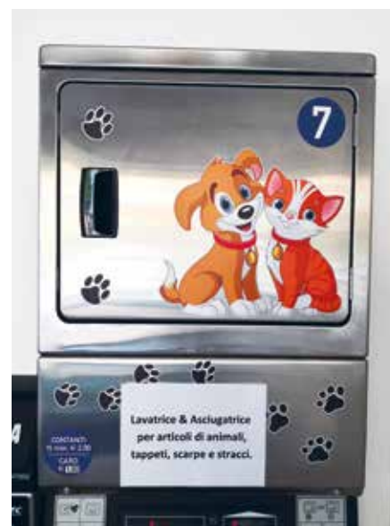
La lavanderia è attenta agli animali

📍 Francesca77.arcobaleno 📍 Via Provinciale 55, Vago ☎ 340 7185790