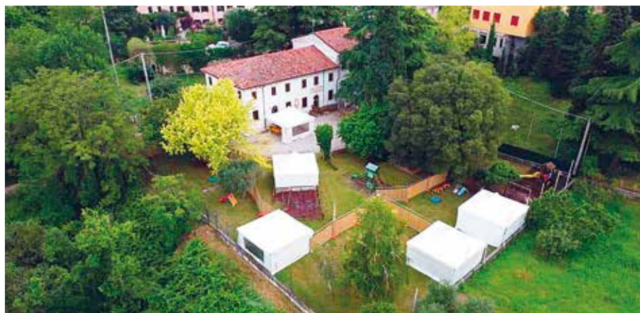
Lo spazio esterno della scuola dell'infanzia di San Briccio durante i Centri Estivi

Per un lungo periodo, troppo lungo, le scuole sono rimaste chiuse, anche quelle dell'infanzia. Le finestre serrate, i cortili vuoti, silenziosi. In pratica, da marzo della primavera scorsa, i nostri piccoli sono tornati a frequentare a settembre, con l'inizio del nuovo anno scolastico. Adattare e organizzare le scuole, i luoghi, gli spazi, i tempi e i gruppi, nel rispetto del protocollo Covid, ha richiesto uno sforzo notevole da parte di tutti, i Presidenti con i Comitati, gli insegnanti e il personale delle rispettive realtà. L'Amministrazione Comunale, sensibile ai bisogni delle tre scuole rispetto ad una partenza complicata anche da un punto di vista economico, è intervenuta, già alla fine di agosto, con l'erogazione di un contributo straordinario a sostegno. Così come, con un ulteriore contributo, le ha supportate nella realizzazione dei Centri Estivi per i nostri piccoli da 0 a 6 anni.