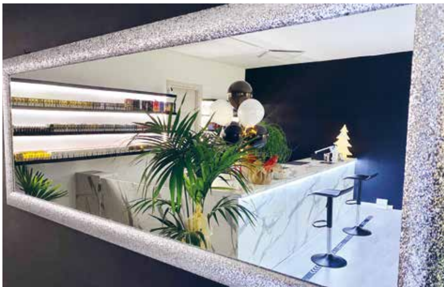
L'interno del negozio di fumo elettronico 'Zero Vaping-smoking'

Zero Vaping-Smoking. Recenti studi hanno dimostrato come lo svapo riduca del 90% i rischi legati al fumo tradizionale. Zero nasce da un connubio tra qualità e varietà di prodotti e una particolare attenzione alle esigenze della clientela, che unite ad uno studio del design interno permette di vivere non una semplice compravendita ma un'esperienza. Con la particolare cura del servizio perso-