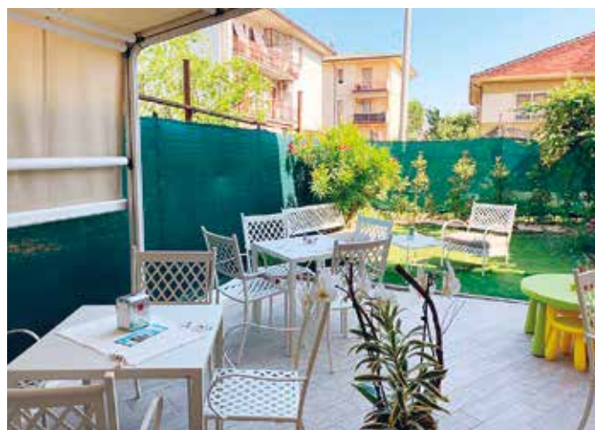
Lo spazio esterno della sala da tè 'Leggi e Gusta'