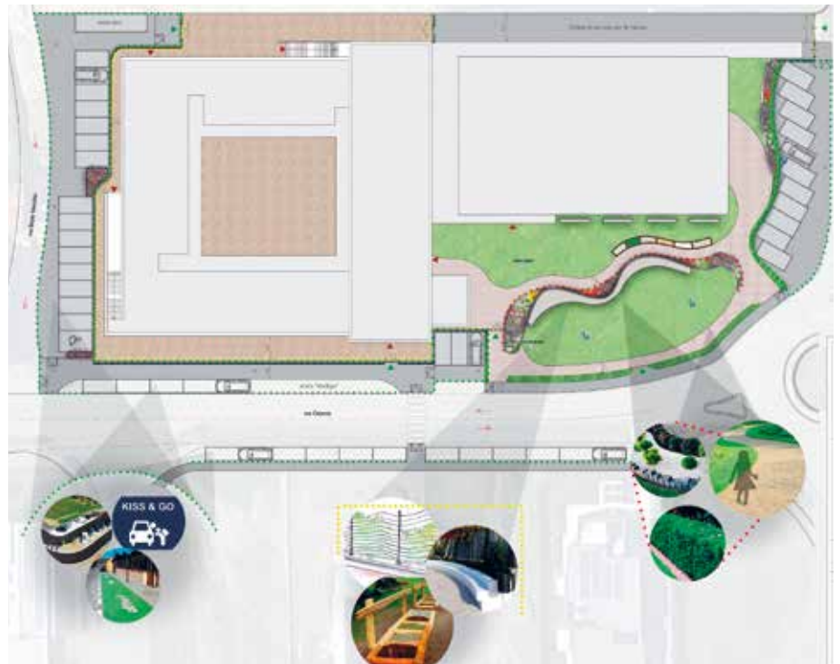
Il nuovo progetto che prevede la sistemazione delle aree esterne della scuola e che prevede circa 40 posti auto

La ripresa dei lavori, dopo un ulteriore stop amministrativo, sta portando alla luce la nuova struttura scolastica: nel frattempo abbiamo deliberato un intervento che riguarda l'esterno. Dagli incontri pubblici abbiamo raccolto la preoccupazione per i pochi parcheggi antistanti la nuova scuola, pertanto con l'ufficio tecnico abbiamo elaborato un nuovo piano che prevede la sistemazione delle aree esterne, che ha portato all'individuazione di circa 40 posti auto, oltre che alla corsia definita 'kiss & go' (si tratta di una corsia che permette di avvicinarsi all'entrata della scuola con l'auto e di lasciare direttamente il figlio all'ingresso senza dover parcheggiare, per poi proseguire. Tradotto letteralmente 'un bacio e via'). Per far questo abbiamo rivisto e rimodulato gli spazi verdi, in modo che mantengano la loro superficie, ricavando comunque