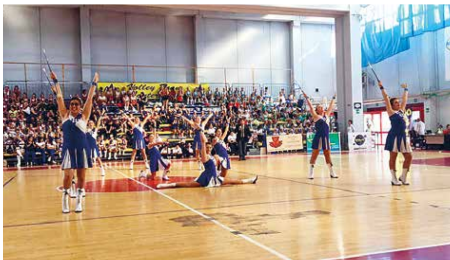
Le Majorettes di Lavagno