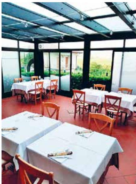
Una sala della Trattoria 'San Pietro'

Trattoria San Pietro. La Trattoria San Pietro propone ricette della tradizione rielaborate dai propri chef, per offrire la migliore esperienza di gusto possibile. La nuova proposta è di presentare la 'buona cucina italiana', fatta di sapori semplici e cose buone, con particolare attenzione alla tradizione veronese.