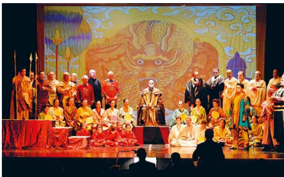
L'Associazione Musicale 'San Filippo Neri'