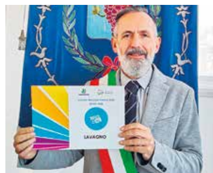
Il Sindaco con l'attestato

Legambiente 'Comune Riciclone'. Questo premio però non deve essere visto come un punto di arrivo ma come partenza per impegnarci tutti a fare di più, soprattutto riducendo la parte del rifiuto secco