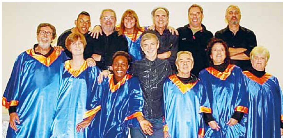
Il coro gospel 'Happy Day Group'

sono esibite nel teatro La Fenice di Venezia, e poi nelle città di Treviso, Jesi, Rimini e Bergamo. In seguito è stato fondato un gruppo corale di adulti che ha interpretato, negli anni, circa una trentina di diversi titoli operistici in più città lombarde e venete. Dal 2013 l'Associazione ha organizzato ogni anno, in collaborazione con l'Amministrazione di Lavagno, un'opera completa di orchestra, scene e costumi. Nel 2020 tutta l'attività concertistica, in seguito alle misure per il contenimento della diffusione del Covid, è stata sospesa. L'intenzione dell'Associazione è di riproporre l'attività didattica organizzando una Scuola di Musica nella frazione di San Briccio di Lavagno. Intendiamo in questo modo contribuire alla ri-