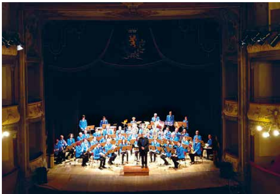
Il Corpo Bandistico 'Carlo Montanari'