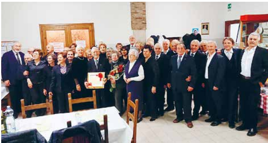
La 'Schola Cantorum San Pietro Apostolo'

Il coro 'La Fonte' è attivo a San Briccio da quarantaquattro anni. La scelta del nome si ricollega ad uno storico evento: la costruzione dell'acquedotto del paese, inaugurato nel luglio del 1896. Quel giorno, nella piazza, di fronte alla fontana che, finalmente, zampillava, si celebrò un evento memorabile; non ci sarebbe più stata la necessità di scendere dalla collina alla pianura per procurarsi l'acqua potabile, come era accaduto fino a quell'istante; l'acqua potabile ora era lì, fuori casa, a disposizione di tutti. Il momento saliente della cerimonia fu quando il coro, diretto allora da Scipione Ruffo, intonò un brano composto per l'occasione, con le parole di Alfonso Chiaffoni e la musica di Tito Dal Dosso: "A la