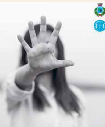
25 novembre: Giornata Mondiale contro la violenza sulle Donne.