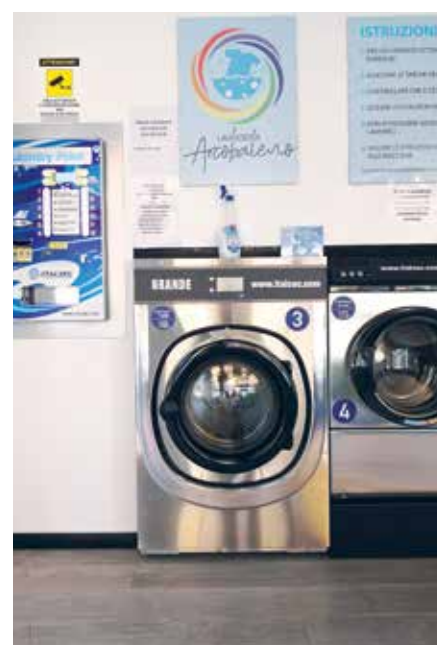
La Lavanderia Arcobaleno