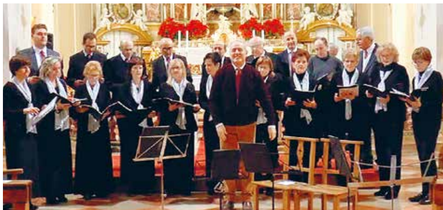
La corale 'Don Alberto Lonardoni'