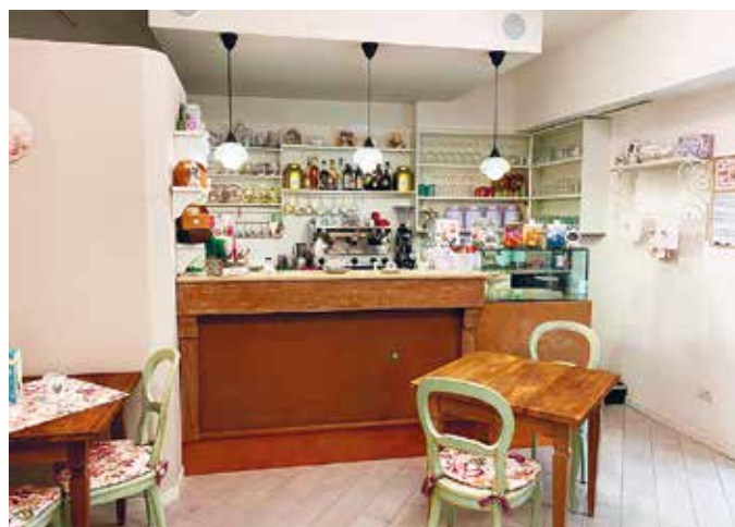
L'edicola 'Leggi e Gusta' è attenta all'ecologia