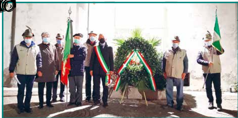
Le Celebrazioni per il 4 Novembre si sono svolte in tutti i centri del Comune: a San Pietro, San Briccio e Vago. Nella foto la cerimonia a San Briccio