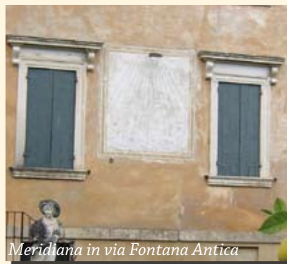
Meridiana in via Fontana Antica