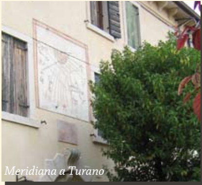
Meridiana a Turano

P assando per le strade della nostra vallata, sulla facciata di ville antiche o di case rurali, ogni tanto il nostro sguardo si imbatte in quei quadranti solari, scoloriti dal sole e dal tempo, che testimoniano il desiderio di chi vi abitava di aggrapparsi alla luce del giorno, alla