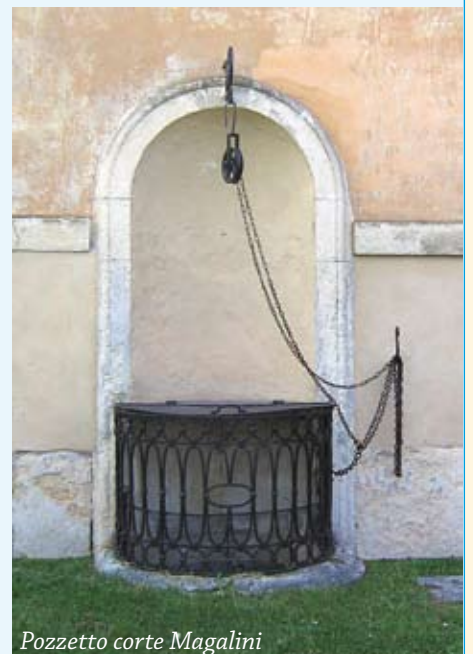
Pozzetto corte Magalini