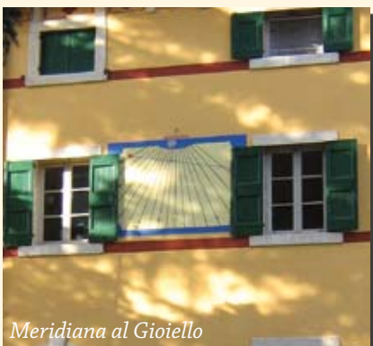
Meridiana al Gioiello