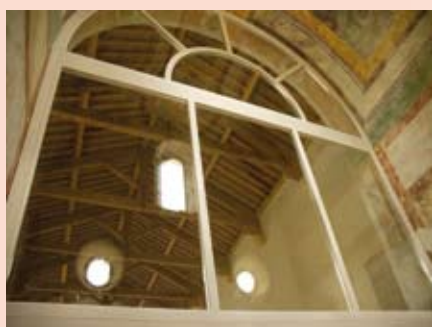
Chiesa di S. Rocco-Soave