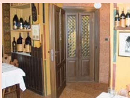
Bottega del Vino-Verona