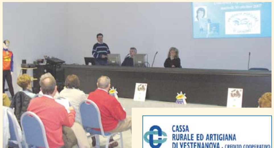
Incontro tematico nella Sala Convegni di Vagotex

- martedì 4 marzo 2008 , dalle ore 16,30 alle 18,00: “Internet non è solo navigazione ma tutto un insieme di servizi utili”.