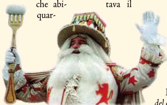
La maschera di Papà del Gnoco

In mattinata in quasi la totalità delle cucine veronesi si ripete l'antico rituale. In una casseruola sono poste a cuocere le patate, con la buccia naturalmente; le si passa al setaccio o all'apposito schiacciapate e le si impasta con continua a pag. 4