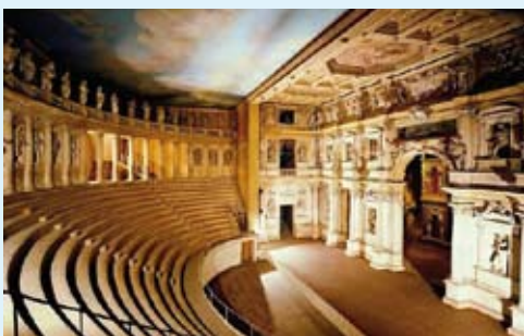
15 febbraio 2009 Vicenza Teatro Olimpico