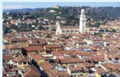
18 febbraio 2009 Verona vista dalla Torre dei Lamberti

CATTOLICA SOCIETÀ CATTOLICA DI ASSICURAZIONE 1911, 1985