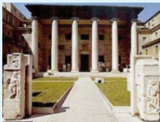
Verona - Museo Maffeiano